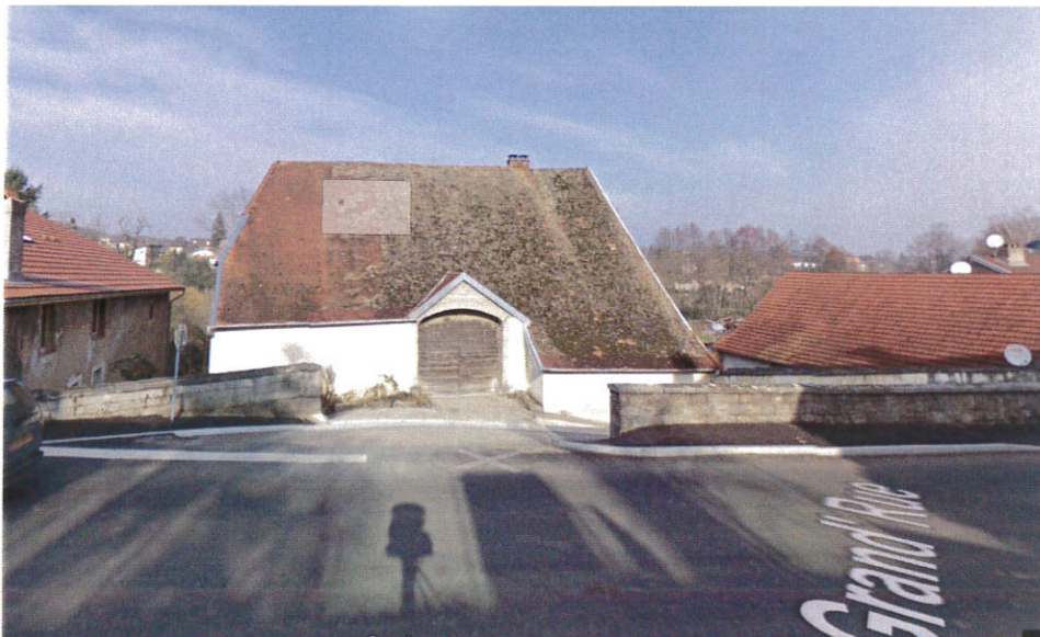
Ajout panneau déviation Boulton (Carrefour RD 367 – RD 15)