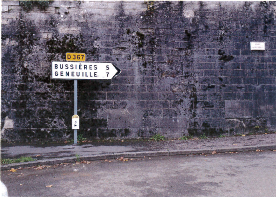
Aucune modification à prévoir (Carrefour RD 367 – RD 15)