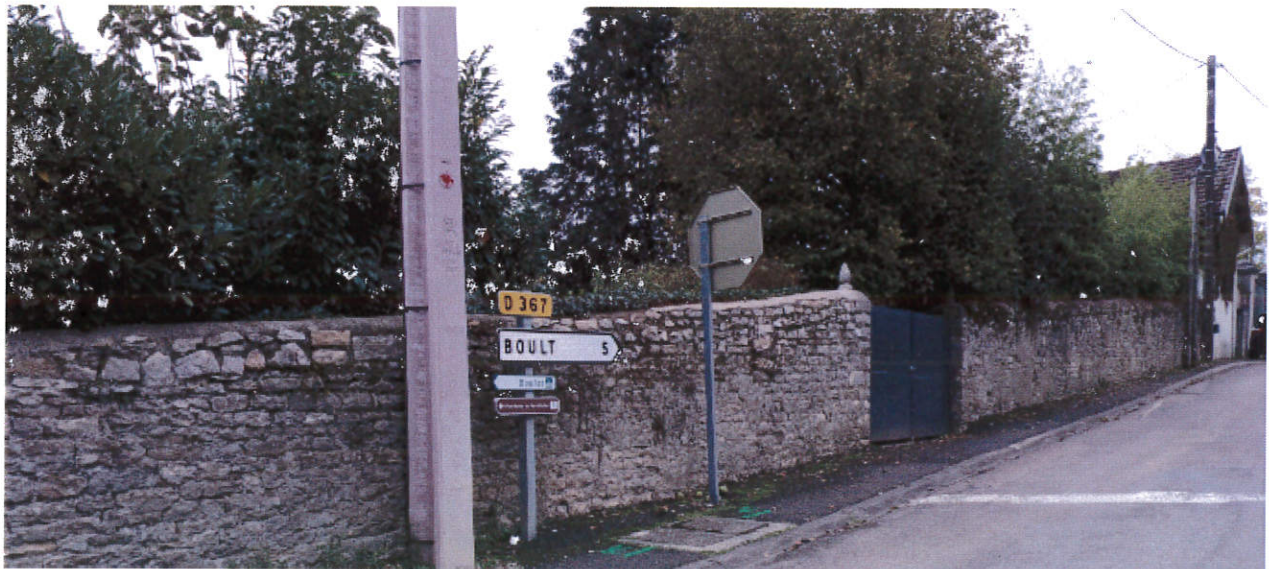
Ajout d'un panneaux déviation Boulot