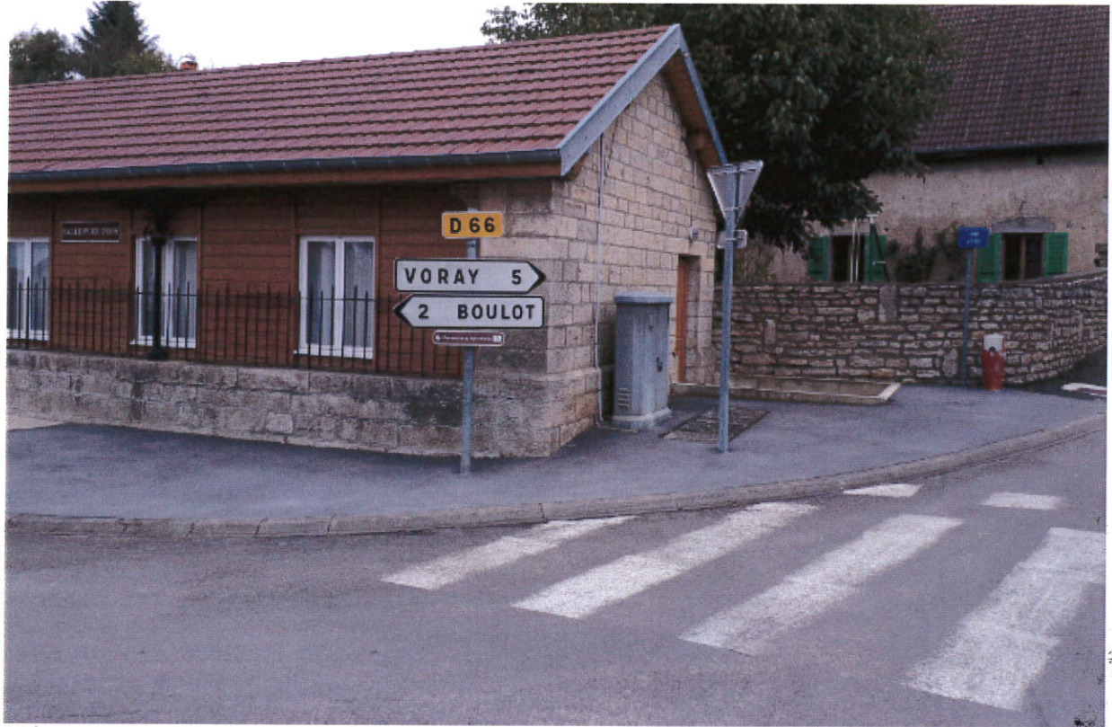
Masquage des panneaux Boulot Ajout d'un panneaux déviation Boulot