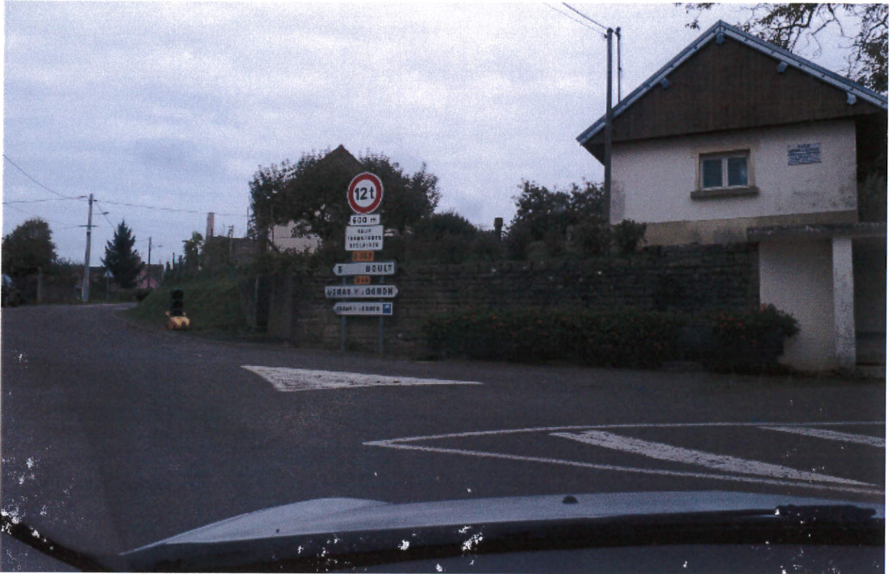
Masquage du panneau 12 tonnes